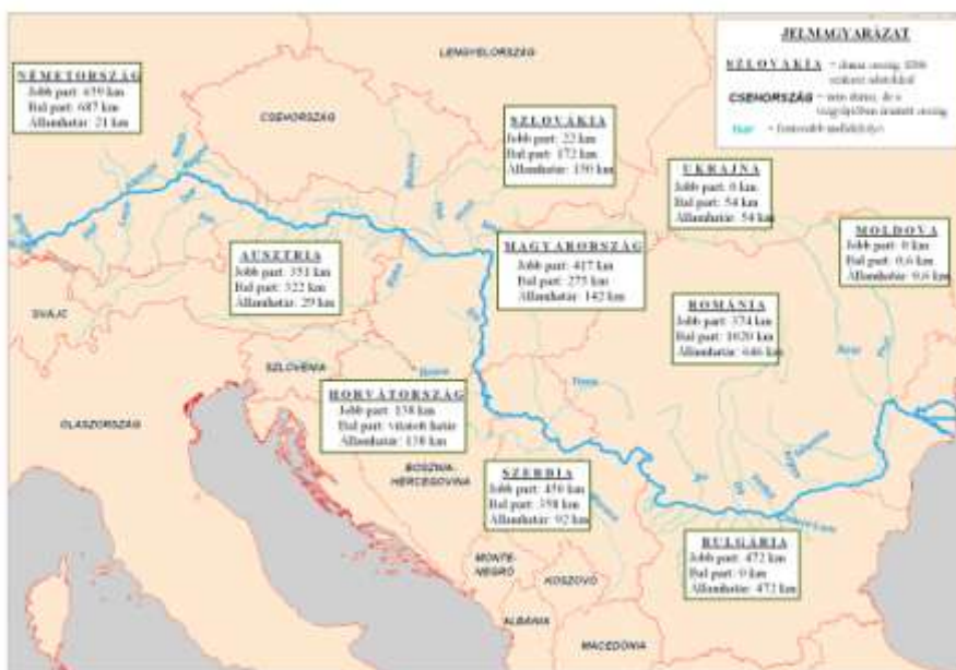
2. ábra. A Duna vízgyűjtő országai

Forrás: Hardi Tamás szerkesztése. Kilométer adatok a Nemzetközi Duna Bizottság adatai alapján (2004).