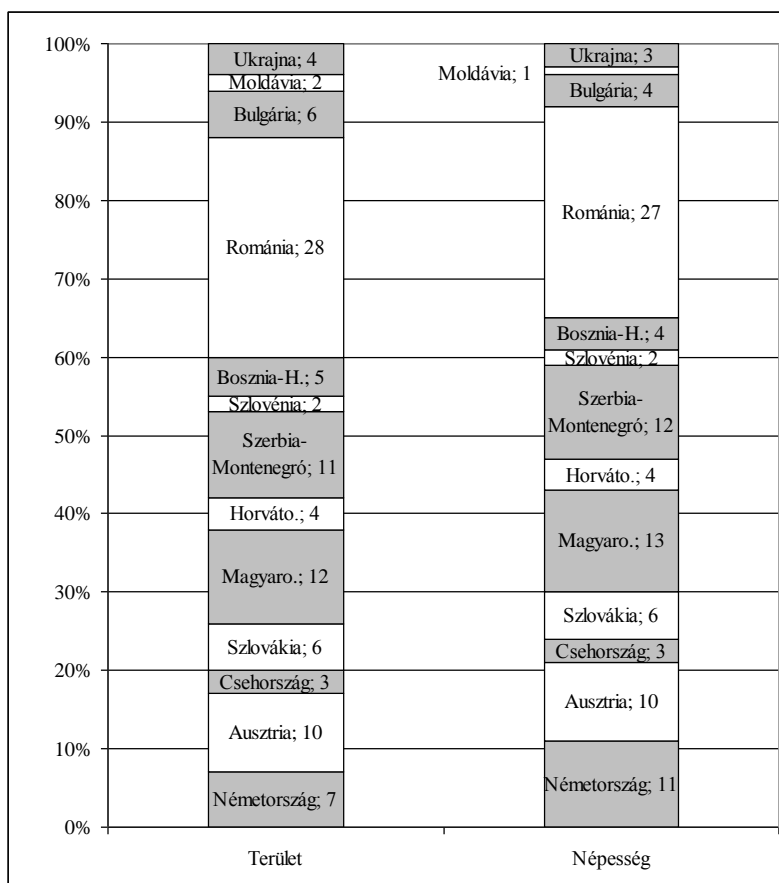
3. ábra. A vízgyűjtő területének és népességének megoszlása az egyes államok között (a kis részesedéssel rendelkező államok nélkül)