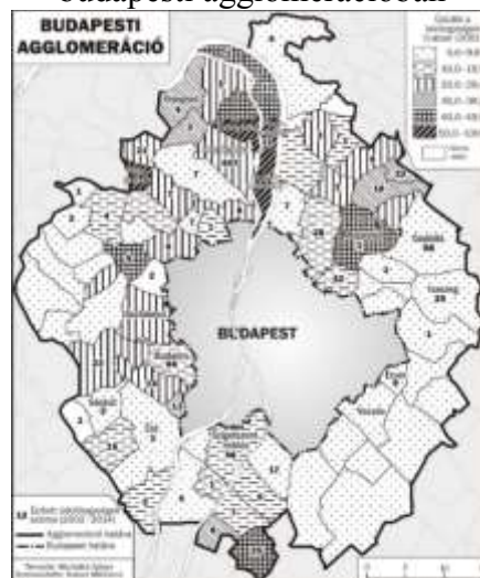
1. ábra: Az üdülőfunkció (2001) és az üdülőingatlanok számának növekedése (2002–2014) a budapesti agglomerációban

A budapesti agglomerációs zónában található üdülőket tekintve a 2011. évi népszámlálás közel 42 ezer üdülőt jegyez, amely 2002–2014 között összességében mindössze +3,8%-kal növekedett. Ez számszerűsítve +1 613 db üdülőt jelent. Szentendrén a népszámlálás idején az üdülők aránya az összes lakóegység százalékában mérve 23,1% volt, és a teljes agglomerációt tekintve a város az agglomeráción belül lévő üdülőállomány 6,1%-ával rendelkezett 4 . A 2002–2014 közötti növekményt vizsgálva szembevetendő, hogy Szentendrén növekedett a legnagyobb arányban az üdülők volumene az agglomeráción belül, amely +407 üdülőegységet jelent (1. ábra). Az ábrán jól látszik, hogy az agglomerációs üdülővezeti centrum (Szigetmonostor, Pócsmegyer és Leányfalu) közvetlenül Szentendre mellett, a Duna közelében található.